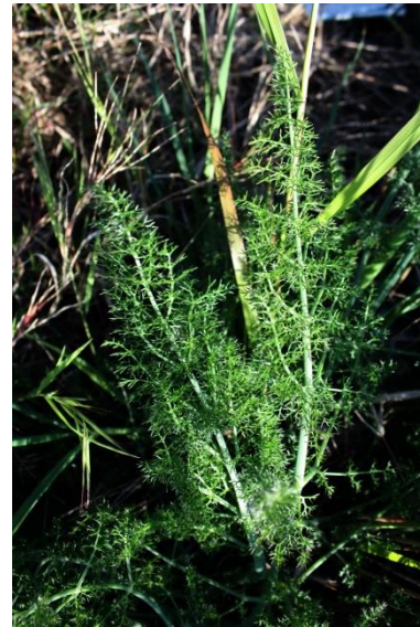
Imatge: Servei Meteorològic de Catalunya