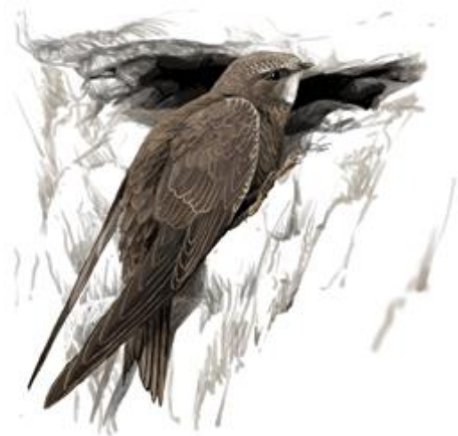
Il·lustrador: Toni Llobet