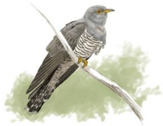
Il·lustrador: Toni Llobet