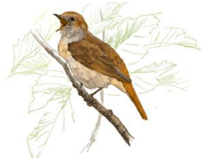
Il·lustrador: Toni Llobet