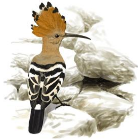
Il·lustrador: Toni Llobet