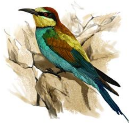
Il·lustrador: Toni Llobet