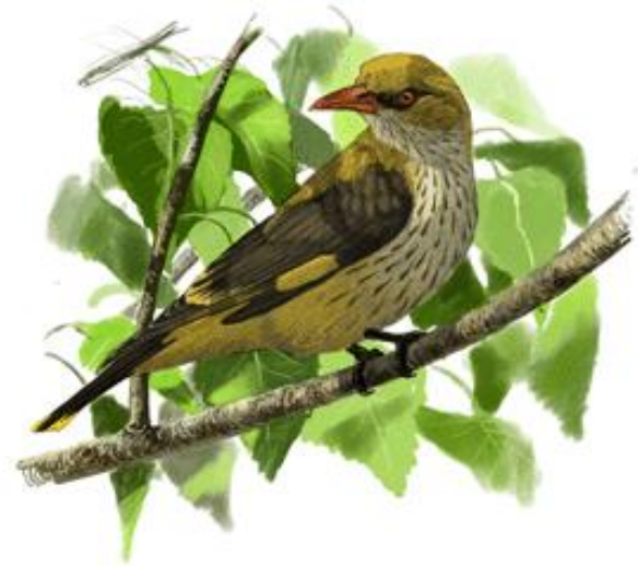
Il·lustrador: Toni Llobet