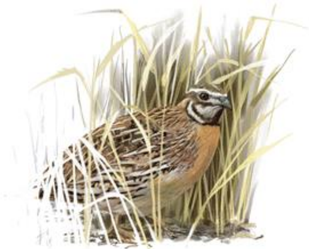
Il·lustrador: Toni Llobet