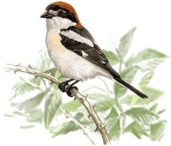
Il·lustrador: Toni Llobet