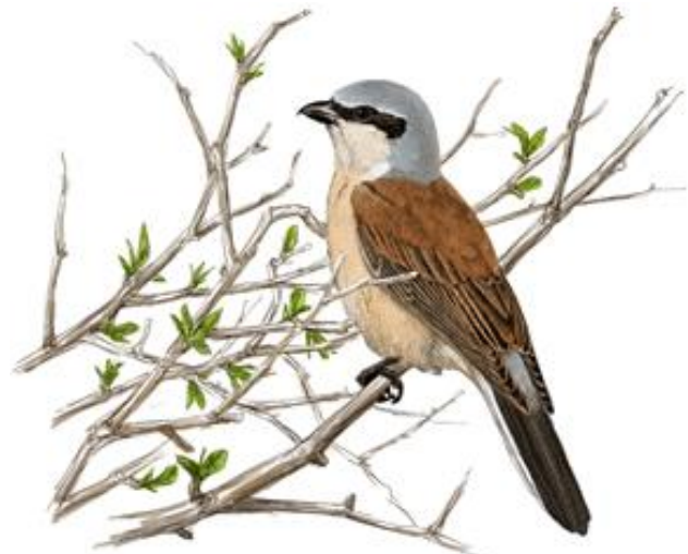
Il·lustrador: Toni Llobet